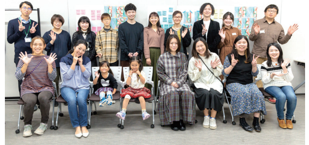
2022年度川崎市男女共同参画センター協働事業として制作した「ジェンダーもやもや発見カード」(上)と2022年11月川崎市総合自治会館で実施した「ジェンダーもやもやワークショップ」参加者